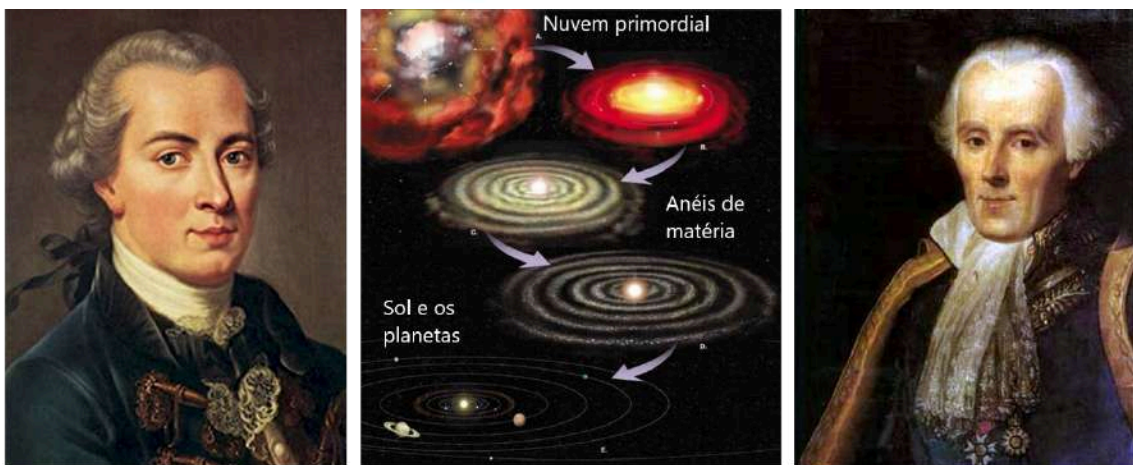
Figura 3 – (Esq.) O filósofo Immanuel Kant. (Centro) Representação artística das fases da formação do sistema solar conforme a teoria de Laplace (1796). [Fonte: este link ]. (Dir.) O matemático e físico Pierre Simon de Laplace.