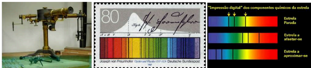
Figura 5 – (Esq.) Espectroscópio de Kirchhoff-Bunsen para análise da luz [Fonte: este link ]. (Centra) Selo alemão comemorando o 200º aniversário do nascimento de J. R. Fraunhofer (1987), que inclui figura representando o espectro da luz solar com suas muitas linhas escuras características [Fonte: este link ]. (Dir.) Espectro da luz de uma estrela em repouso e em movimento, ilustrando o fenômeno do desvio para o vermelho . [PEÇANHA DA ROCHA, 2019].

Ao longo do século, se multiplicariam também as publicações especializadas em Astronomia na Europa e nos EUA, essenciais para a divulgação das investigações em curso e a popularização da Ciência, como a revista alemã " Astronomische Nachrichten " (1823), sob inspiração do astrônomo Franz X. von Zacha (1754-1832), e a " L'Astronomie ", fundada por Camille Flammarion em 1882, que é editada até hoje. Sociedades e associações privadas foram fundadas em vários países – como a inglesa Royal Astronomical Society (1820), a 1ª. delas, e a Société Astronomique de France , fundada em 1887 por Flammarion –, visando contribuir para o desenvolvimento da Astronomia por meio de estudos, seminários, divulgação de fatos e acontecimentos, e também a cooperação internacional com outras entidades. Um exemplo famoso desse tipo de colaboração foi a do francês Urbain Le Verrier e do alemão Johann G. Galle (1812-1910) na descoberta do planeta Netuno , em 1846. [ROSA, 2012]