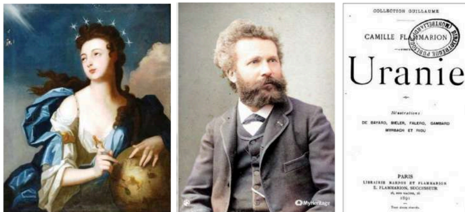
Figura 1 – (Esq.) A musa Urania, da mitologia grega. Retrato alegórico de Urânia. (Centro) O astrônomo Camille Flammarion. (Dir.) O livro Uranie (Urânia, em português), publicado por Flammarion em 1889 [AUTORES ESPÍRITAS CLÁSSICOS, S/N].

Urânia é ainda o título de um livro escrito, em 1889, por Camille FLAMMARION [2011] (1842-1925) (Fig. 1), célebre astrônomo francês. O livro relata o encontro onírico entre um jovem e Urânia, a musa da Astronomia, e estabelece ligações entre a astronomia e o espiritismo . [SAMPAIO, 2021]