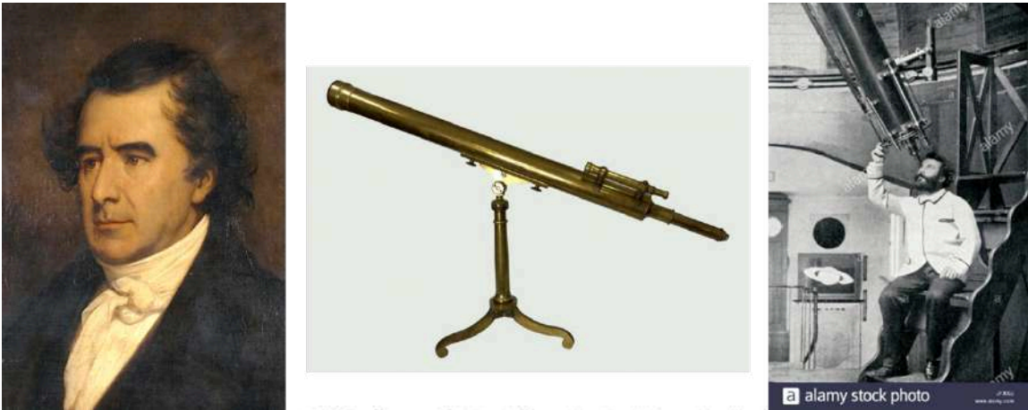
Figura 4 – (Esq.) O astrônomo François J.D. Arago. (Centro) Uma luneta típica do século XIX. (Dir.) O astrônomo Camille Flammarion olhando no telescópio do Observatório de Juvisy, fundado por ele em 1883, na França [AUTORES ESPÍRITAS CLÁSSICOS, S/N].

Tal qual a invenção da luneta e a criação da Mecânica Celeste no século XVII, marcos fundamentais na evolução da Astronomia, o desenvolvimento da Análise espectral – da qual nasceria a Astrofísica – viria a caracterizar a Astronomia do século XIX, permitindo obter informações sobre as estrelas a partir da análise do espectro da luz que emitem. A medição trigonométrica da paralaxe de uma estrela , com a determinação de sua distância, e a avaliação da posição estelar usando sextantes , foram também acontecimentos históricos na técnica de medição astronômica (Fig. 2). O emprego da fotografia nas pesquisas astronômicas seria igualmente responsável por avanços na observação dos corpos celestes, permitindo comparar exposições de uma mesma região do céu obtidas em momentos diferentes e melhorar as medições de distâncias estelares. [ROSA, 2012]